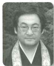
東京・光輪幼稚園園長