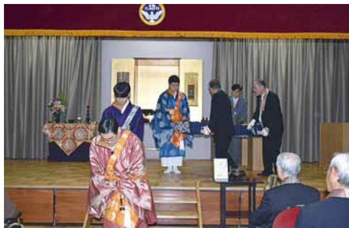
御本尊を担いで本堂へ