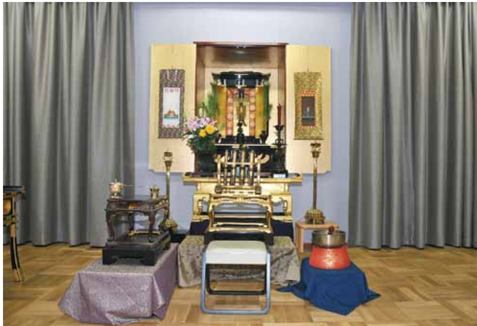
太子堂が 仮本堂に