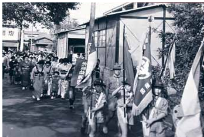
落慶法要では稚児行列も行った

その後翌年 3 月にはそれまでのかまぼこ型の遊戯室を建て替え「太子ホール」が完成。舞台の中央に聖徳太子の童形像（南無仏太子像）を安置した。昭和 61 年には本堂の裏手に 2 階建ての客殿ならびに庫裡が完成した。また新時代を見据え、それまでの書院をロビーならびに寺務所に改装し、すべて土足のまま上られるようになった。