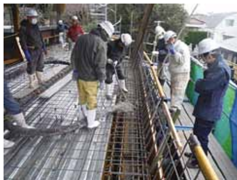
太子堂の斜めの外壁にコンクリート打設

あるため職人にとっても厳しい環境での仕事になります。しかも夏の猛暑の中の作業は、想像を絶する過酷さです。また工事用車両の出入りの際は光輪幼稚園の園児さん、門徒の皆様様の安全にも当然ながら配慮しなければなりません。既存建物を利用しながらの工事ですので、現場は相当な気配りが求められました。