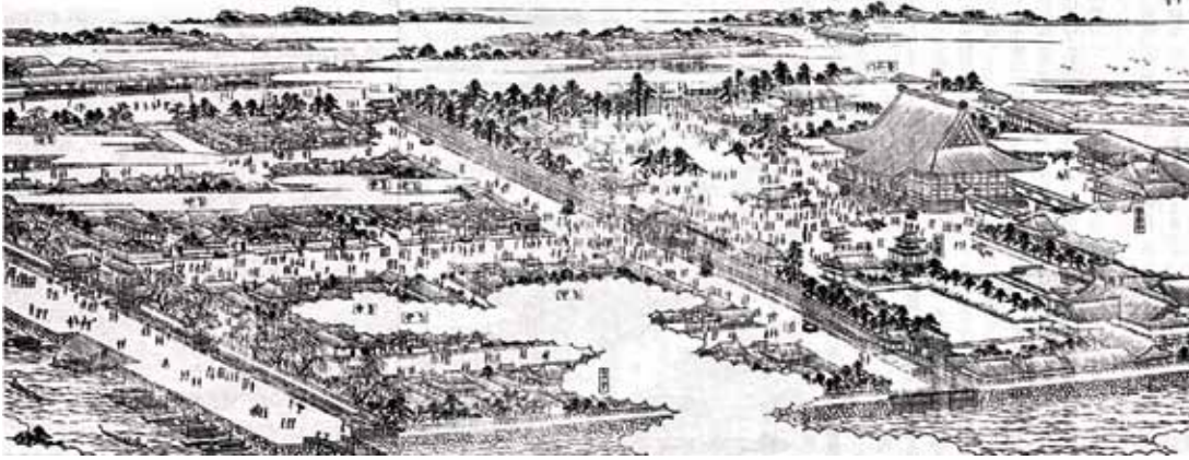
江戸時代の築地本願寺。左の入口の本堂に向かって左側に善永寺があった

といい、浜町御坊創建の功により、正面に位置を占め、「表四箇寺」と称したと伝えられている。