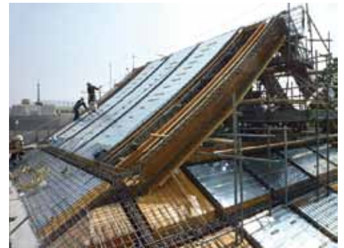
本堂屋根の型枠を組む作業風景

ふわりと浮いたような銅板の大屋根ですが、実はコンクリートで出来ています。木造であれば宮大工が得意としますが、今回の本堂は法規上、耐火建築物が求められているため、コンクリートで造らなければなりません。果たして優美な屋根をコンクリートで造れるか。こちらも設計者、施工者ともに初めての試みでした。さらにこの屋根は西本願寺本堂、御影堂に合わせた屋根勾配を採用していますが、これは急勾配で