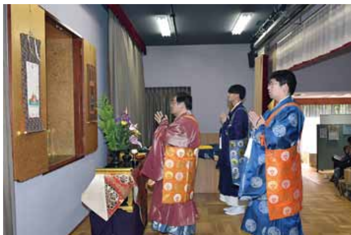
仮本堂 (太子堂) にて法要