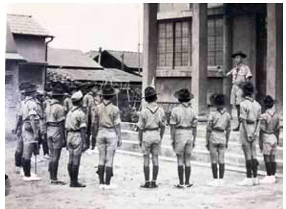
新本堂前でスカウト達

これは佛祖の加護は勿論のこと、偏えに檀信徒各位の御懇念のたまものと、感謝に耐えない次第である。