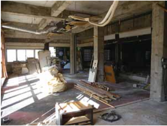
解体中の本堂とホール