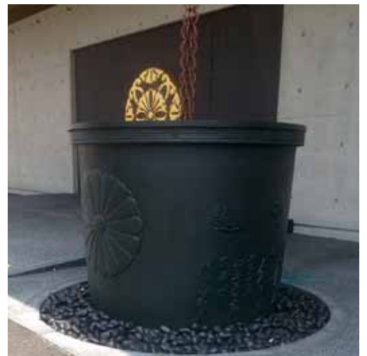
江戸時代の天水桶