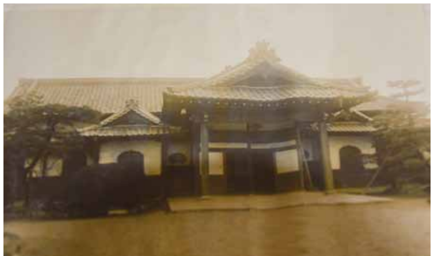
戦前の善永寺書院玄関

大震災後の復興に尽力し、善永寺は都心の教線を守ったが、東京の復興と人口の飛躍的増加は東京周辺地域の教線に不足を告げしむるものあり、築地にあっては、日本橋よりの魚河岸の移転と、区画整理による減分の高率による寺域の狭隘は、復興建設を不可能に陥らしめ、ここに移転の止むなきに至った。