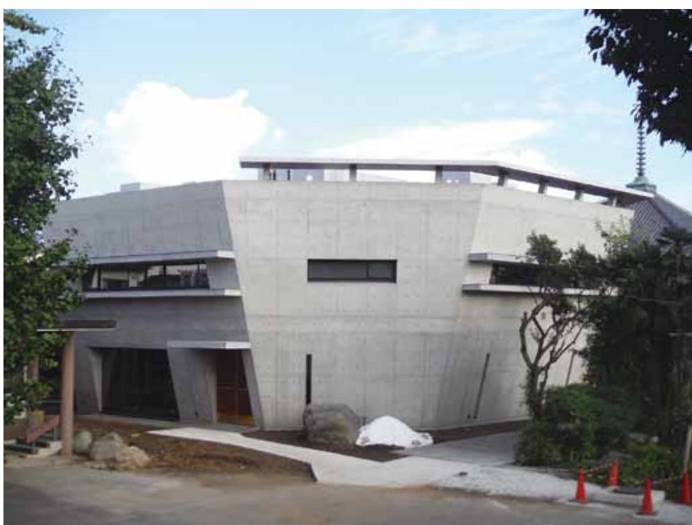
2016 (平成 28) 年 9月4日竣工