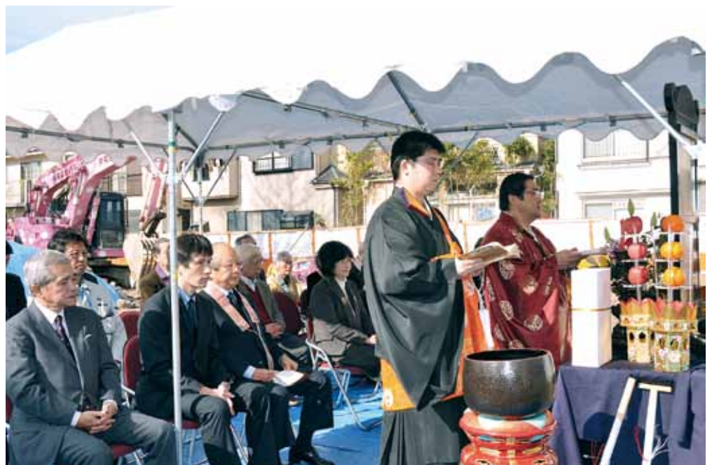
本堂 起工式 2017 (平成 29) 年 1月 19日