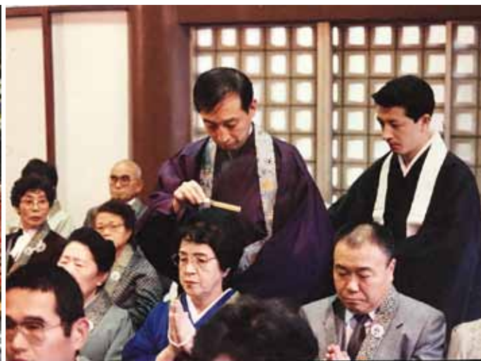
即如門主 右は帰敬式