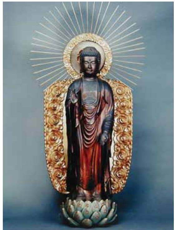
阿弥陀如来像大田区文化財に指定

との記載がある。この時期麻布善福寺末、または門徒として江戸勸勝坊、三島善教寺、江戸