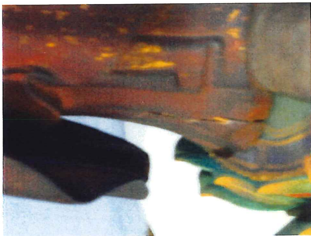
背面 裾 左側